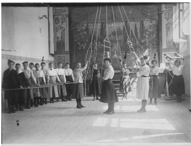
Abb. 4: Turnsaal des Mädchengymnasiums Sillgasse, o. J.

Im Schuljahr 1983/84 zählte die Schule mittlerweile zur größten allgemeinbildenden Schule Tirols. Im Sommer 1984 maturierten letztmalig drei Klassen mit ausschließlich Mädchen. Die Ära des Mädchengymnasiums war nun endgültig vorbei. 88