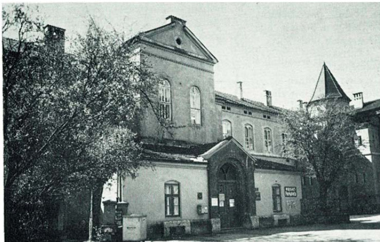
Ab.3: Schulgebäude in der Michael-Gaismair-Straße 1

Sieben Jahre später sollte der Umbau beginnen. 83 Das Bundesrealgymnasium für Mädchen übersiedelte inzwischen in die Michael-Gaismair-Straße 1.