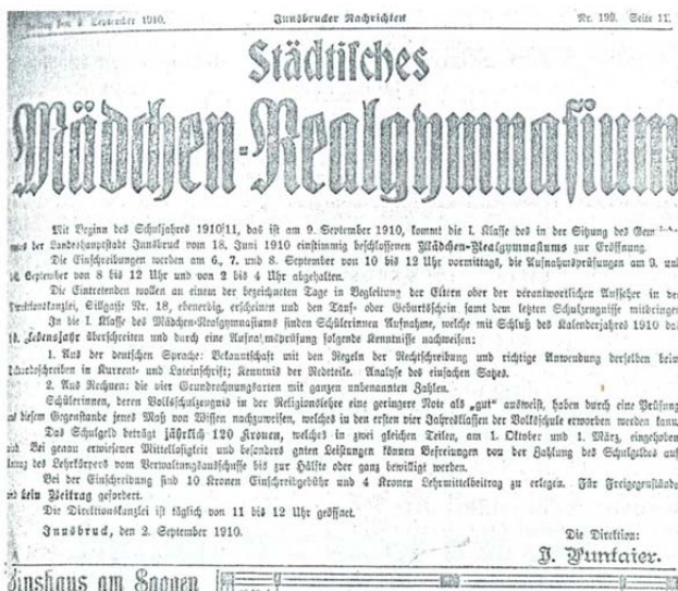
Abb. 1: Kundmachung in den Innsbrucker Nachrichten am 3. September 1910

Sofern Bewerberinnen im Religionsunterricht eine schlechtere Note als „Gut“ erhielten, mussten diese ihre Kenntnisse über den in der Volksschule gelernten Stoff mittels separater Prüfung nachweisen. 58