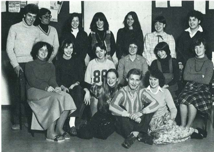
Abb. 12: Foto der Abschlussklasse 8B im Schuljahr 1978/79.

schülerinnen wurden bemängelt. Kurzfristig wurde sogar überlegt, wieder zur monoedukativen, und damit geschlechtertrennenden Schule, zurückzukehren. 103